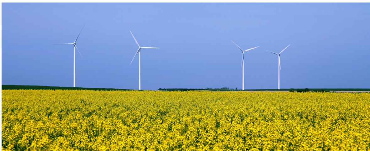
Éoliennes du parc de Lhuître, Grandville et Dosnon